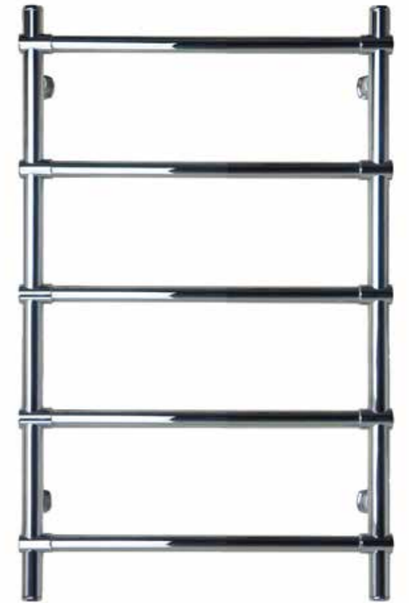
Rak modell, krom 500 x 800 mm (b x h) Effekt: 114 W Art nr 8730253