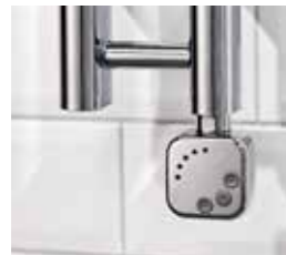
Lusso, krom För dolt montage Art nr 8716508 Med stickkontakt Art nr 8716505

Alterna Lusso Elpatron för dolt montage eller med stickkontakt. Microprocessor. IP54. Vridbar 330°. Elpatronerna har antifrysfunktion, 2 timmars timerfunktion och 4 temperatursteg, 30–60 °C. 230 V, 300 W.