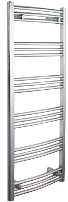
Svängd modell, rund design, förkromad 500 x 1 244 mm (b x h) Effekt: 324 W Art nr 8759495