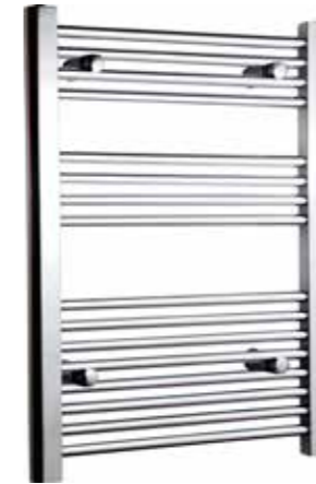
Rak modell, rund design, förkromad

Alterna Caldo Handdukstork är tillverkad i stål och finns i förkromad och vitt matt utförande. För elpatron och/eller värmesystem. Finns med rak eller svängd modell. Med vertikala D-stolpar och runda rör. Levereras med fyra stycken flyttbara väggfästen med 22 mm justerbarhet i djupled, två stycken proppar samt en luftningsventil.