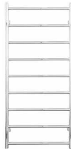
Rak modell, rund design, förkromad 500 x 1 200 mm (b x h) Effekt: 190 W Art nr 8760343