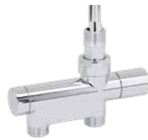
Reglerventil Lusso LR60 Rak För 1-rörs och 2-rörssystem. i förkromad mässing. Inklusive handratt. Levereras i 2-rörsutförande. 60 c/c. Art nr 8737002