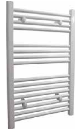
Rak modell, rund design, vit

500 x 800 mm (b x h) Effekt: 246 W Art nr 8760015