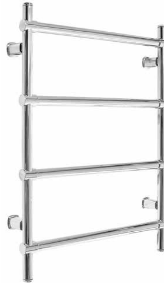
Rak modell, krom 500 x 660 mm (b x h) Effekt: 103 W Art nr 8730100

Alterna Fiamma är en förkromad handdukstork tillverkad i stål. För elpatron och/eller värmesystem. Med raka omfattande runda rör och stolpar. Levereras med 4 st väggfästen med 20 mm justerbarhet i djupled, 2 st proppar samt en luftningsventil.