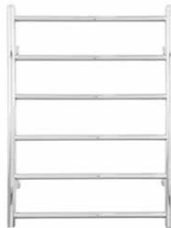
Rak modell, rund design, förkromad 600 x 800 mm (b x h) Effekt: 145 W Art nr 8760342