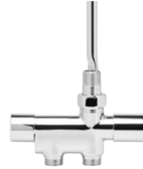
Reglerventil Picto För 1-rörs- och 2-rörssystem. Inklusive handratt. Ska inte kopplas till VVC-system. 40 c/c.

Krom, Art nr 8716621 Svart matt, Art nr 8716622 Vit matt, Art nr 8716623