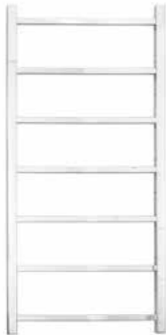
Rak modell, fyrkantig design, förkromad 500 x 1 000 mm (b x h) Effekt: 168 W Art nr 8760424

Alterna Divario Handdukstork är tillverkad i stål och finns i förkromat, svart matt utförande. För elpatron och/eller värmesystem. Samtliga är av rak modell och finns med runda eller fyrkantiga rör och stolpar. Levereras med fyra stycken fast placerade väggfästen med 20 mm justerbarhet i djupled, två stycken proppar samt en luftningsventil.