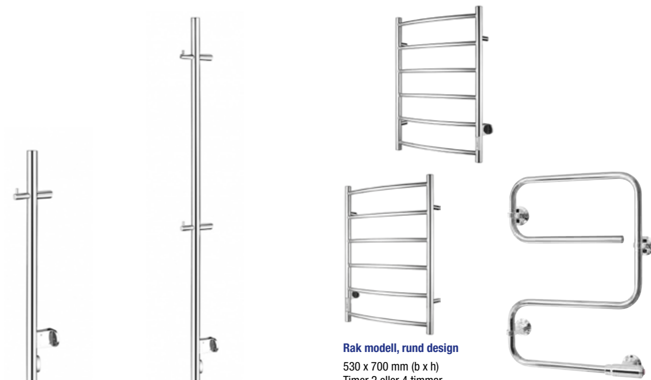
Rak modell, rund design 137 x 800 mm (d x h) Effekt: 15 W Art nr 8754168