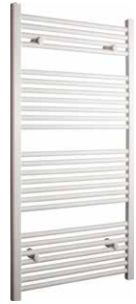
Rak modell, rund design, vit

600 x 1 200 mm (b x h) Effekt: 445 W Art nr 8760016