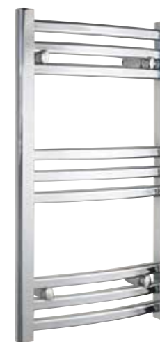
Svängd modell, oval design, förkromad 450 x 770 mm (b x h) Effekt: 176 W Art nr 8759496