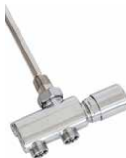
Reglerventil Lusso L1 För 1-rörs- och 2-rörssystem, i förkromad mässing. Inklusive handratt. Kan kompletteras med termostatventil. Avancerade inställningsmöjligheter. 40 c/c. Art nr 8758367