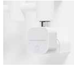
Lusso Tech, vit För dolt montage Art nr 8716574 Med stickkontakt Art nr 8716570