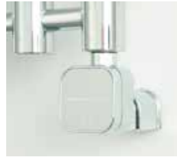
Lusso Tech, krom För dolt montage Art nr 8716576 Med stickkontakt Art nr 8716572

Alterna Lusso Tech Elpatron för dolt montage eller med stickkontakt. Enkel att använda. Microprocessor. IPx5. Vridbar 330°. Elpatronerna har antifrysfunktion, 2 timmars timerfunktion och 4 temperatursteg, 30–60 °C. 230 V, 300 W.