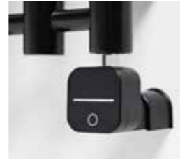
Lusso Tech, svart För dolt montage Art nr 8716577 Med stickkontakt Art nr 8716573

Alterna Lusso Elpatron för dolt montage eller med stickkontakt. Microprocessor. IP54. Vridbar 330°. Elpatronerna har antifrysfunktion, 2 timmars timerfunktion och 4 temperatursteg, 30–60 °C. 230 V, 300 W.