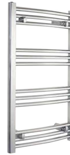
Svängd modell, rund design, förkromad 500 x 800 mm (b x h) Effekt: 213 W Art nr 8759493