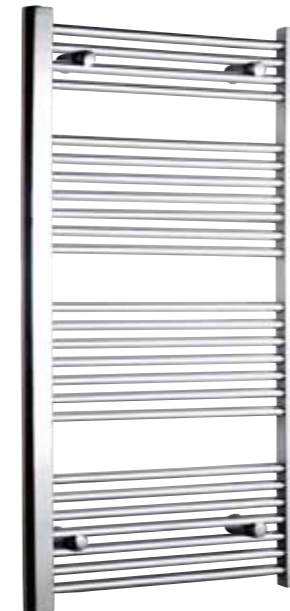
Rak modell, rund design, förkromad

500 x 800 mm (b x h) Effekt: 358 W Art nr 8760017