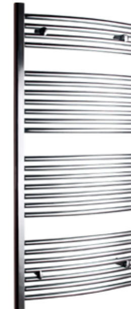
Svängd modell, rund design, förkromad

600 x 1 200 mm (b x h) Effekt: 445 W Art nr 8760014