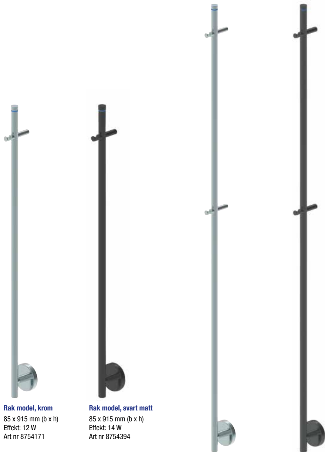
Rak model, krom 85 x 915 mm (b x h) Effekt: 12 W Art nr 8754171

Alterna Rod Elhanddukstork i förkromat eller svart matt stål. För fast anslutning eller med stickkontakt. Med runda rör. IP44. Levereras med väggfästen.