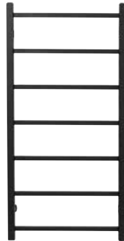
Rak modell, fyrkantig design, svart matt 500 x 1 000 mm (b x h) Effekt: 256 W Art nr 8730252