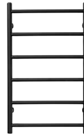
Rak modell, rund design, svart matt 500 x 800 mm (b x h) Effekt: 186 W Art nr 8730246