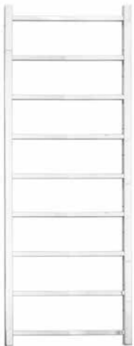
Rak modell, fyrkantig design, förkromad 500 x 1 400 mm (b x h) Effekt: 225 W Art nr 8760425