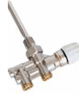
Reglerventil Primeo För 1-rörs- och 2-rörssystem, i förnicklad mässing. Inklusive handratt. Kan kompletteras med termostatventil. Avancerade inställningsmöjligheter. 40 c/c. Art nr 8758309

Krom, Art nr 8716621 Svart matt, Art nr 8716622 Vit matt, Art nr 8716623