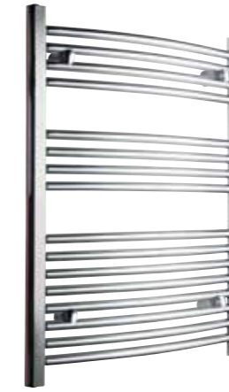
Svängd modell, rund design, förkromad

500 x 800 mm (b x h) Effekt: 246 W Art nr 8760013