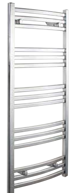
Svängd modell, oval design, förkromad 500 x 1 180 mm (b x h) Effekt: 305 W Art nr 8759499