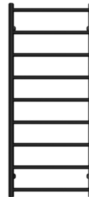
Rak modell, rund design, svart matt 500 x 1 200 mm (b x h) Effekt: 279 W Art nr 8730251