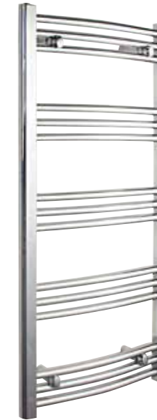
Svängd modell, rund design, förkromad 500 x 1 022 mm (b x h) Effekt: 289 W Art nr 8759494