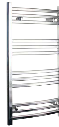
Svängd modell, oval design, förkromad 500 x 950 mm (b x h) Effekt: 250 W Art nr 8759498