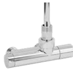
Reglerventil Lusso LR60 Vinklad För 1-rörs och 2-rörssystem. i förkromad mässing. Inklusive handratt. Levereras i 2-rörsutförande. 60 c/c. Art nr 8737003