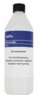
Glykol till handdukstorkar Alterna antikorrosionsmedel för handdukstorkar. 1 liter. Koncentrat. Blandas enligt instruktion på förpackningen. Förbättrar korrosionskyddet, reducerar alg tillväxt samt förhindrar frysnings. Får endast användas i kombination med elpatron, ej vid inkoppling på värmesystemet. Art nr 8760526