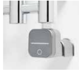
Lusso Tech, silver För dolt montage Art nr 8716575 Med stickkontakt Art nr 8716571