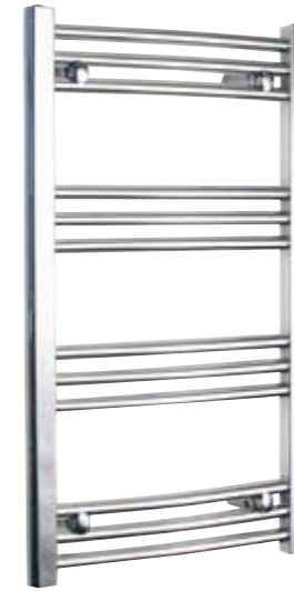
Svängd modell, rund design, förkromad 450 x 800 mm (b x h) Effekt: 197 W Art nr 8759492

Alterna Scalda är en förkromad handdukstork tillverkad i stål. För elpatron och/eller värmesystem. Modellen är svängd, med vertikala D-stolpar och runda eller ovala rör. Levereras med fyra stycken flyttbara väggfästen med 22 mm justerbarhet i djupled, två stycken proppar samt en luftningsventil.