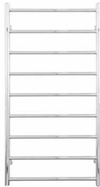
Rak modell, rund design, förkromad 600 x 1 200 mm (b x h) Effekt: 204 W Art nr 8760344