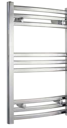
Svängd modell, oval design, förkromad 500 x 770 mm (b x h) Effekt: 190 W Art nr 8759497