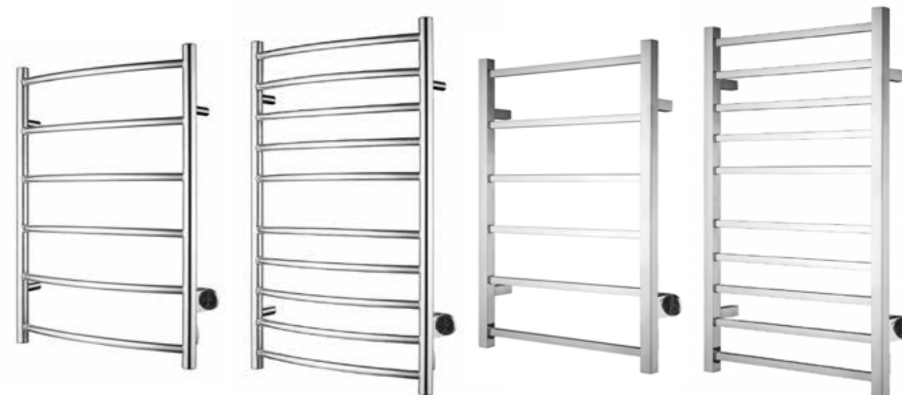
Rak modell, rund design 530 x 700 mm (b x h) Effekt: 60 W Art nr 8754425

Alterna Ray Elhanddukstork i polerat rostfritt stål. För fast anslutning eller med stickkontakt, IP44. Med runda respektive fyrkantiga rör och stolpar. Levereras med 4, 3 eller 2 väggfästen, beroende på modell.