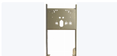
Tvättställsfixtur universal justerbar