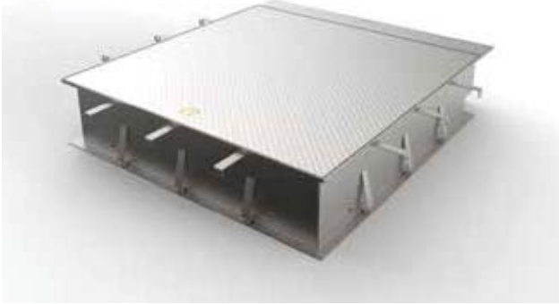
Bilden kan innehålla specialutrustning

Manlucka , plan montering för gång- och/eller fordonstrafik i klasserna A15, B125, D400, E600, regntät, trycklöst luktät, inbrottsskyddad, fyrkantig, av rostfritt stål materialnr 1.4307 (AISI 304 L).