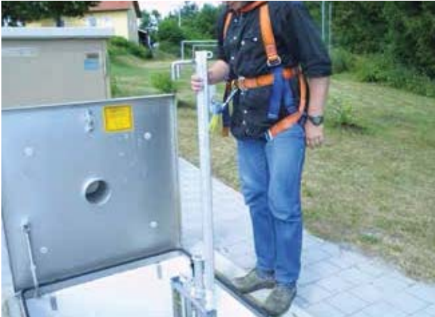
Ingångsstöd, isättningsbart EH FSS D monterat

Stegar måste ha en fasthållningsanordning vid utgångsstället. Detta krav är uppfyllt om stegen skjuter ut minst 1,1 m med en eller båda balkarna vid utstigningsstället.