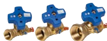
GOP830 DN20 DN25 DN32

ESBE:s Injusteringsventil serie GOP830 används för att balansera flöden i värme- och kylsystem.