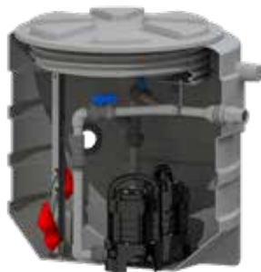
Sanipump GR S

Tank med förmonterad hydraulik, 2 avstängningsventiler och backventiler, 3 flottörer installerade i tanken, 1 eller 2 Sanipump GR eller VX, larmbox, kedjor, kabelgenomföring och Smart kontrollbox (med 2 st. pumpversioner).