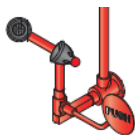
Utan skål 17 455 009

ALLTERNATIVA MODELLER & TILLBEHÖR (övriga modeller och tillbehör se www.broen-lab.com )