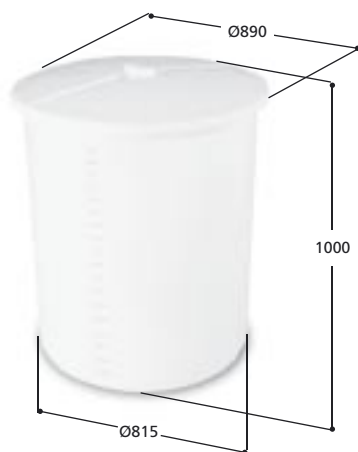
Volym 520 liter Art. nr 10520, vikt 22,0 kg