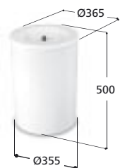
Volym 50 liter Art. nr 10050, vikt 4,0 kg