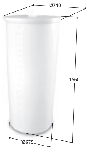
Volym 500 liter Art. nr 10500, vikt 20,0 kg