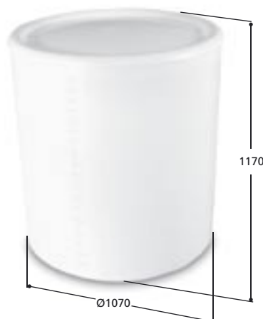
Volym 1000 liter Art. nr 11000, vikt 40,0 kg