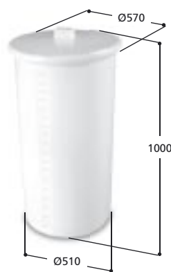
Volym 200 liter Art. nr 10200, vikt 11,5 kg