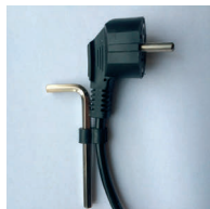
Insexnyckel på sladden.