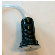
Luftslang ska sitta fast i knappen.

Om kvarnen inte fungerar beror det oftast på att något har fastnat. Dra ur strömsladden , säkerställ att inget fastnat i malkammaren – om något fastnat peta då loss det och kontrollera med insexnyckeln (underifrån) att kvarnen kan rotera. Sätt i strömsladden, tryck på den röda säkringsknappen, vänta en minut – starta kvarnen. Om felet kvarstår kontakta kundtjänst hos din fastighetsägare eller Matkvarn www.matkvarn.se