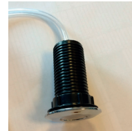
Luftslang ska sitta fast i knappen.