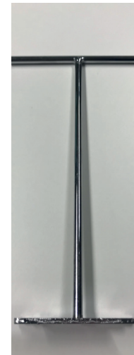
Losstagningsverktyget som du använder om något fastnat.

Om kvarnen inte fungerar beror det oftast på att något har fastnat. Dra ur strömsladden, säkerställ att inget fastnat i malkammaren – om något fastnat använd då losstagningsverktyget för att få loss det som har fastnat i malkammaren. Sätti strömsladden, tryck på den röda säkringsknappen, vänta en minut – starta kvarnen. Om felet kvarstår kontakta kundtjänst hos din fastighetsägare eller Matkvarn. www.matkvarn.se