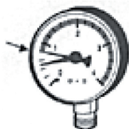
Manometerinställning vid max arb tryck