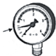
Manometerinställning före vattenpåfyllning