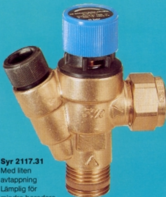
Syr 2117.31 Med liten avtappning Lämplig för mindre beredare