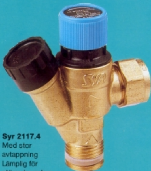
Syr 2117.4 Med stor avtappning Lämplig för större beredare