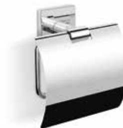
S-line WC-pappershållare i krom