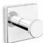
S-line enkelkrok i krom