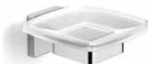
S-line tvålkopp i krom och frostat glas