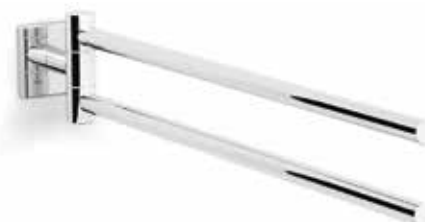
S-line handduksstång, dubbel, svängbar