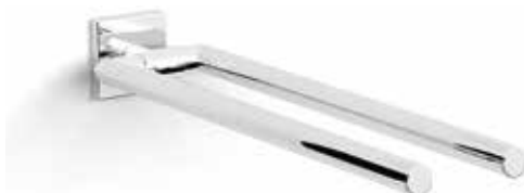
S-line handduksstång, dubbel