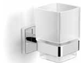
S-line tandborsthållare i krom och frostat glas

Modern design och enkel rengöring. Badrumstillbehör i förkromad mässing.