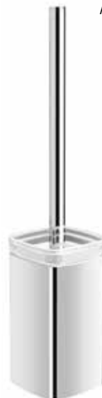
S-line WC-borste med fristående hållare i krom och frostat glas