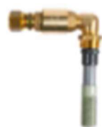
5 Diffusörarmatur inkl. backventil