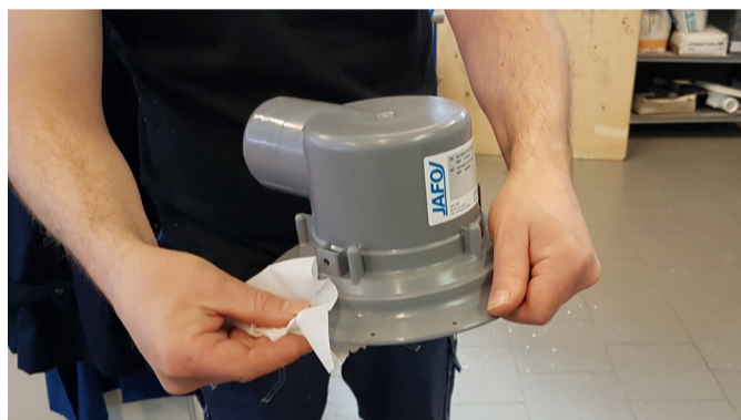
4. Torka av flänsen på golvbrunnen.