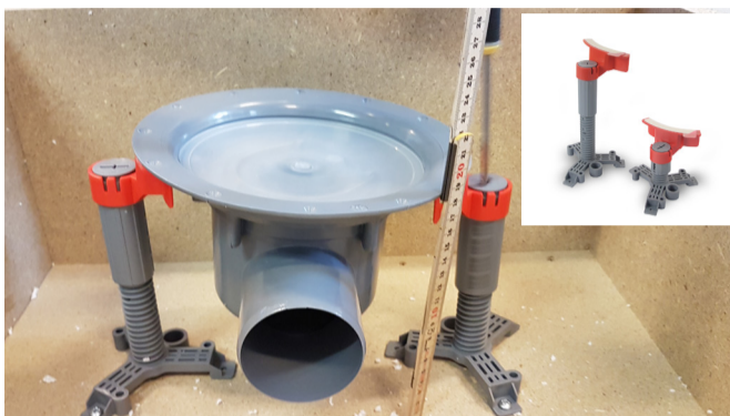
2. Maxhöjd 230 mm. Kan även kapas för lägre installation. Både ben och gänghylsa kan kapas.