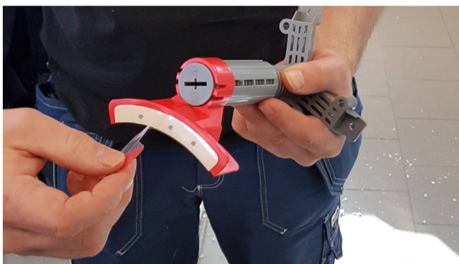
5. Lossa skyddsfolien på tejprensan.