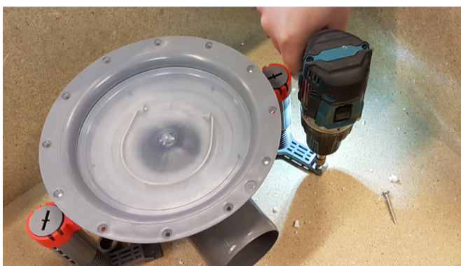
8. Skruva eller skjut fast stödbenen i underlaget. För infästning i betong kan spikplugg i dimension Ø5 mm användas. För infästning i cellplast-isolering i en grund används 200 mm plastspik avsedd för cellplast.