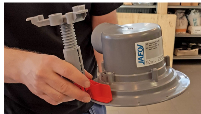
6. Klistra stödet på undersidan av golvbrunnens fläns. Centra hälen i stödet under golvbrunnens flänsens hål.