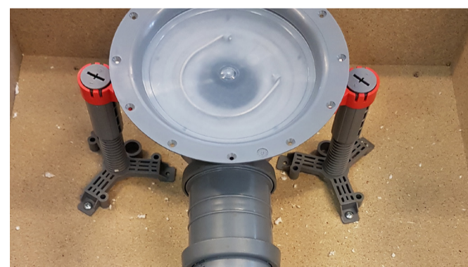
12. Klar för gjutning. Golvbrunnens skyddslock avlägsnas först när tätskiktet ska anslutas.