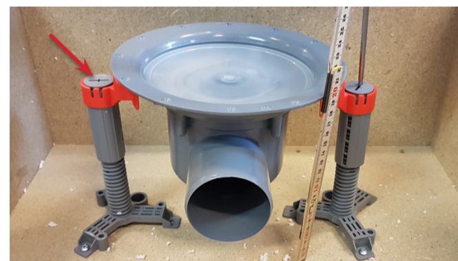
9. Placera golvbrunnen i önskad höjd. Höjden justeras upp på benen.