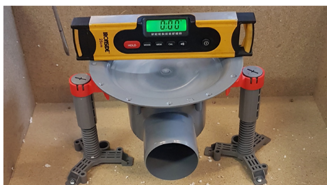
10. Se till att golvbrunnen är i våg.