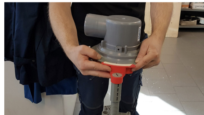
3. Stöden placeras på golvbrunnens fläns.