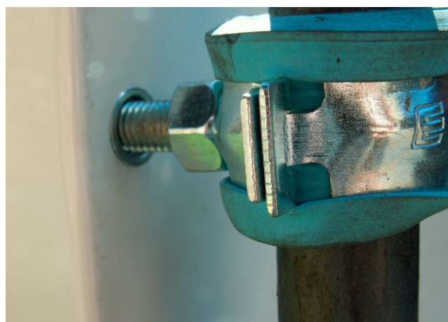
Närbild på infästning mot skåp.

Montera de medföljande fyra M8 bultarna i skåpets baksida (skåpen är försedda med fastsatta gänghål). Skruva på rörklammerna på de utstickande bultarna på baksidan av skåpet. Trä i rundstängerna och trä på stativets bipackade tomrörbitar. Tomrören hindrar stativet från att bli fastgjutet och på så vis gör det återanvändbart. Slå ner rundstängerna genom isolering och ner i sanden tills att installationen känns stadig. Lyft upp skåpet på lämplig höjd samt spänn klammerna.