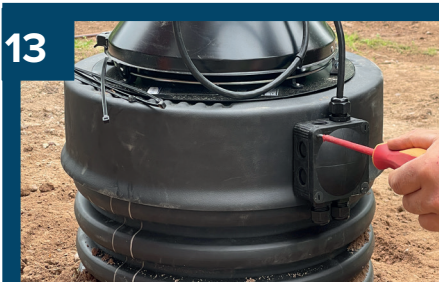
13 Skruva fast locket till styrenheten.