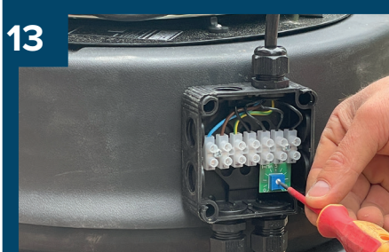
13 Låt en elektriker ställa in rätt flöde.