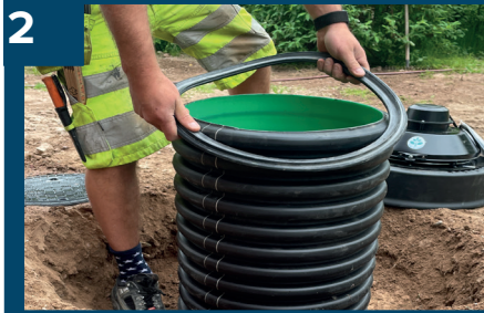
2 Montera tätningen.