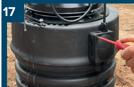
17 Öppna locket till styrenhet.