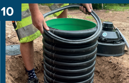
10 Montera tätningen.