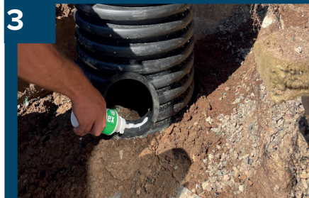
3 Montera packning.