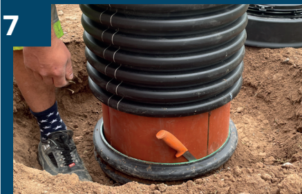
7 Vid behov böjs teleskopör in.