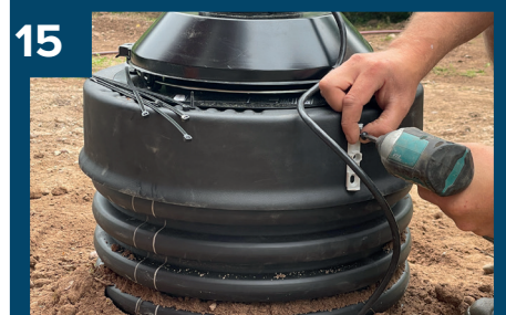
15 Mät in placering och skruva fast.