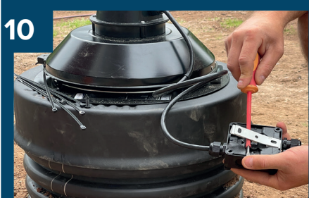
10 Tag loss fästet på styrenhet.