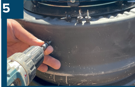
5 Skruva fast locket.