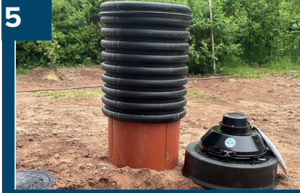
5 Klart för montage av KEO 2.