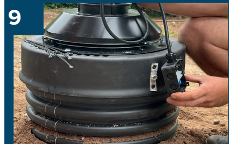
9 Skruva fast styrenhet.