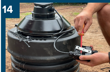
14 Tag loss fästet.