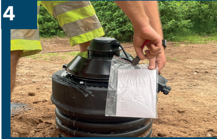
4 Tag bort bruksanvisningen.