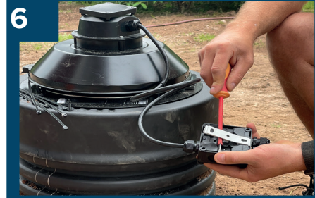
6 Tag loss fästet på styrenheten.