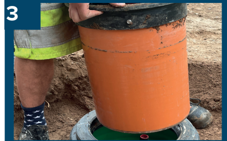
3 Tag bort teleskopörret.