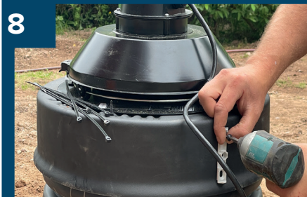
8 Skruva fast fästet till styrenheten.