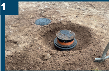
1 Gräv upp runt befintlig brunn.