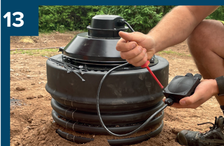
13 Öppna locket till styrenheten.