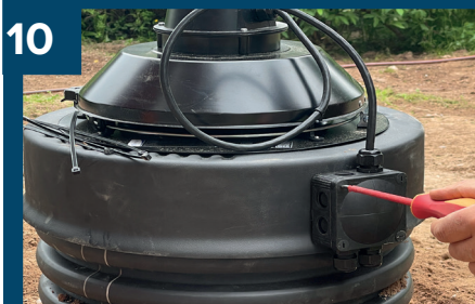
10 Öppna locket till styrenhet.