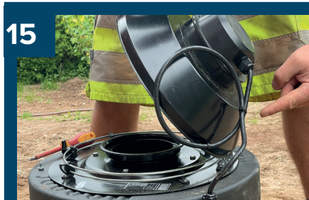
15 Se bild 14.