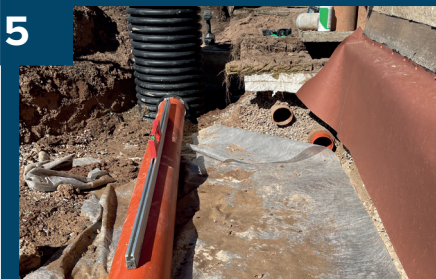
5 Se till att ha fall mot pumpbrunn.