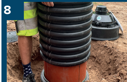
8 Skjut ner teleskopet i botten.