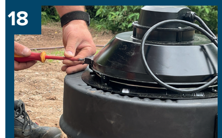
18 Fläkten kan öppnas.