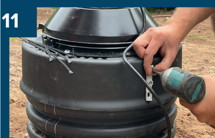
11 Skruva fast fästet till styrenheten.