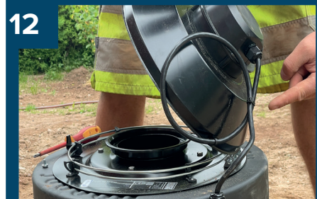
12 Se bild 11.