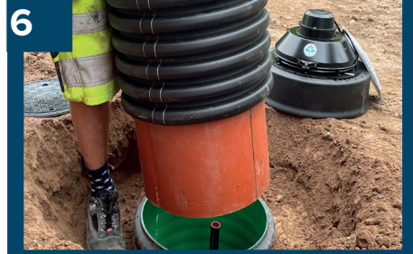
6 Montera teleskop i pumpbrunn.