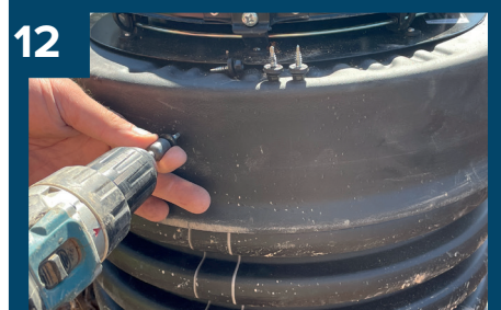
12 Skruva fast locket.