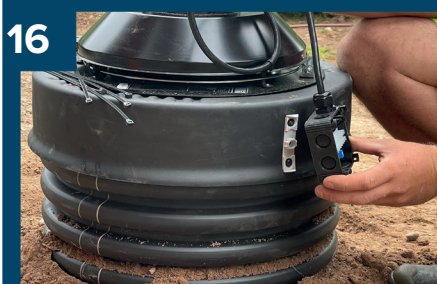
16 Skruva fast styrenhet.