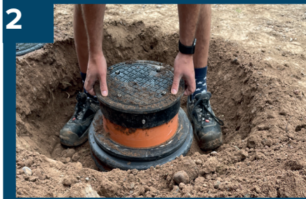
2 Lyft befintligt teleskopör.