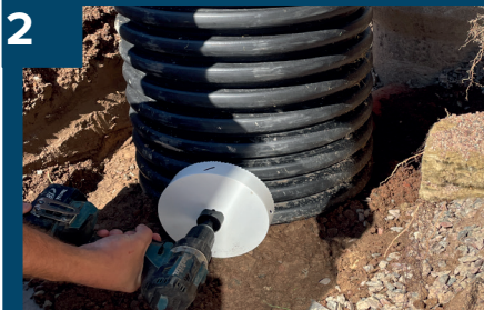
2 Borra upp 160mm hål.