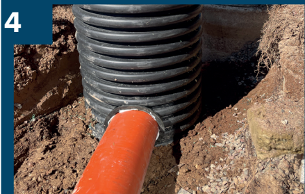
4 Montera 160mm rör.