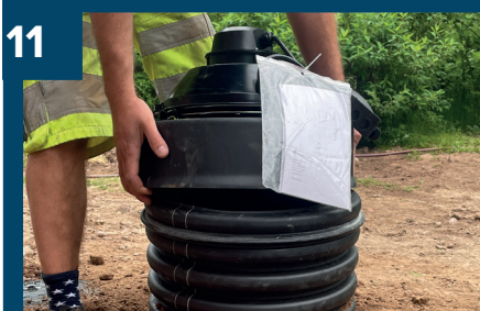
11 Montera lock med fläkt.