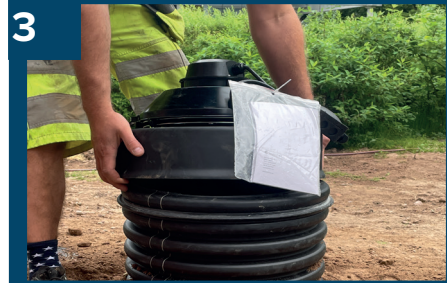
3 Montera lock med fläkt.