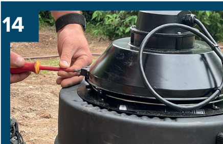
14 Fläkten kan öppnas.