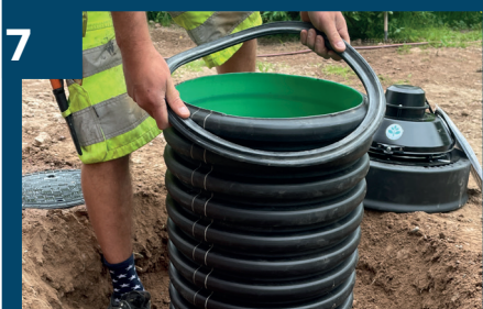
7 Montera tätningen.