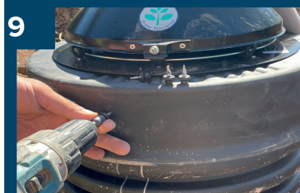
9 Skruva fast locket.