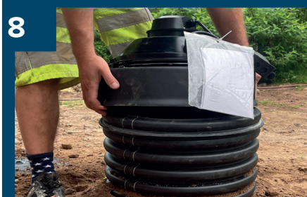
8 Montera lock med fläkt.