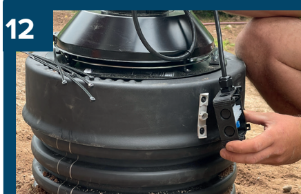
12 Skruva fast styrenhet.