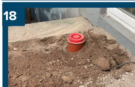
18 Montera ett godkänt tätt lock. Locket täcks med artikel RSK: 7025639.