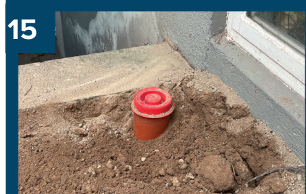
15 Inspektionsrör med tätt lock. Locket täcks med artikel RSK: 7025639.