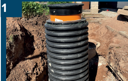
1 Gräv upp befintlig pumpbrunn.