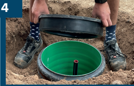
4 Tag bort befintlig förminskning.