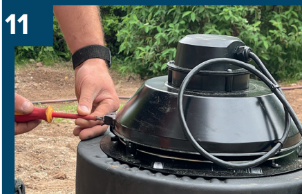
11 Fläkten kan öppnas.