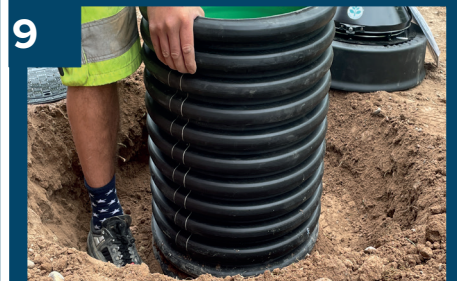
9 Fortsättning bild 8.