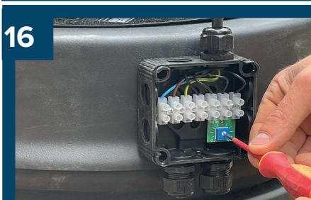
16 Låt en elektriker ställa in rätt flöde.