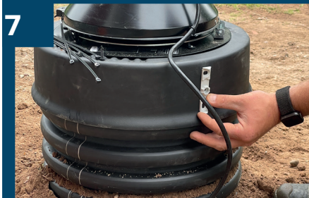
7 Mät in placering.