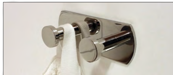
10. Färdig installation! Utan onödiga håltagningar, samt är också möjlig att demontera. Se vidare anvisningar på www.design4bath.se