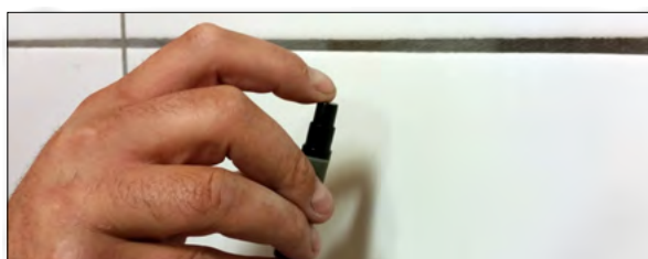
3. Spraya på ytan för infästning. Avlägsnar damm och fett.