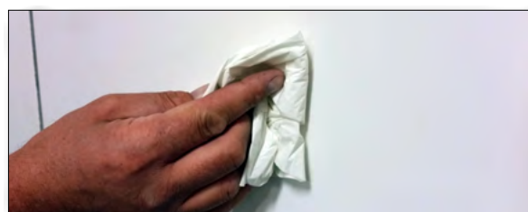
4. Torka ytan ren och torr.