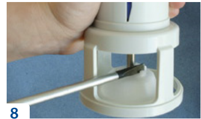
8 Demontera låsbrickan med en mejsel eller en flackstång