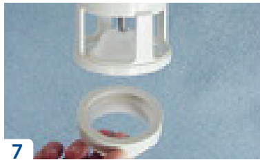
7 Tag bort ventilsåtet