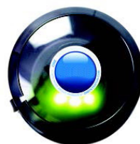
Grön LED, bra.

Aquarent Flex PFAS installeras där vattenledningen kommer in i din fastighet. Led-lampor påvisar när det är dags för byte av filterpatron, vilket sker mycket enkelt helt utan verktyg.