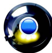
Gul LED, 10 procent kvar innan byte.