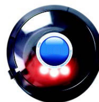
Röd LED, dags för byte.