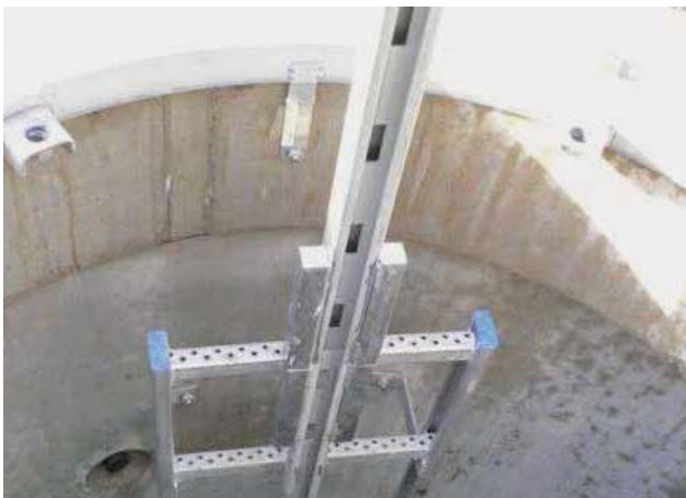
Bilden kan innehålla specialutrustning

Säkerhetsstege med säkerhetsräls, typgodkänd och CE-märkt, enligt UVV är ett fallskydd obligatoriskt fr.o.m. en fallhöjd på 3 m resp. 5 m, enligt SS-EN 14 396, av rostfritt stål materialnr 1.4307 (AISI 304 L), förberett för isättning av ett ingångsstöd.