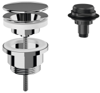
Dome waste valve, chrome-plated