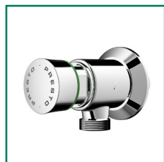
WS 31740, 31742