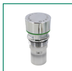
WS 01245 grön