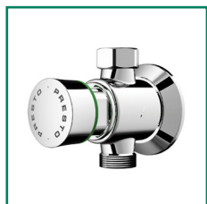
WS 31140, 31142