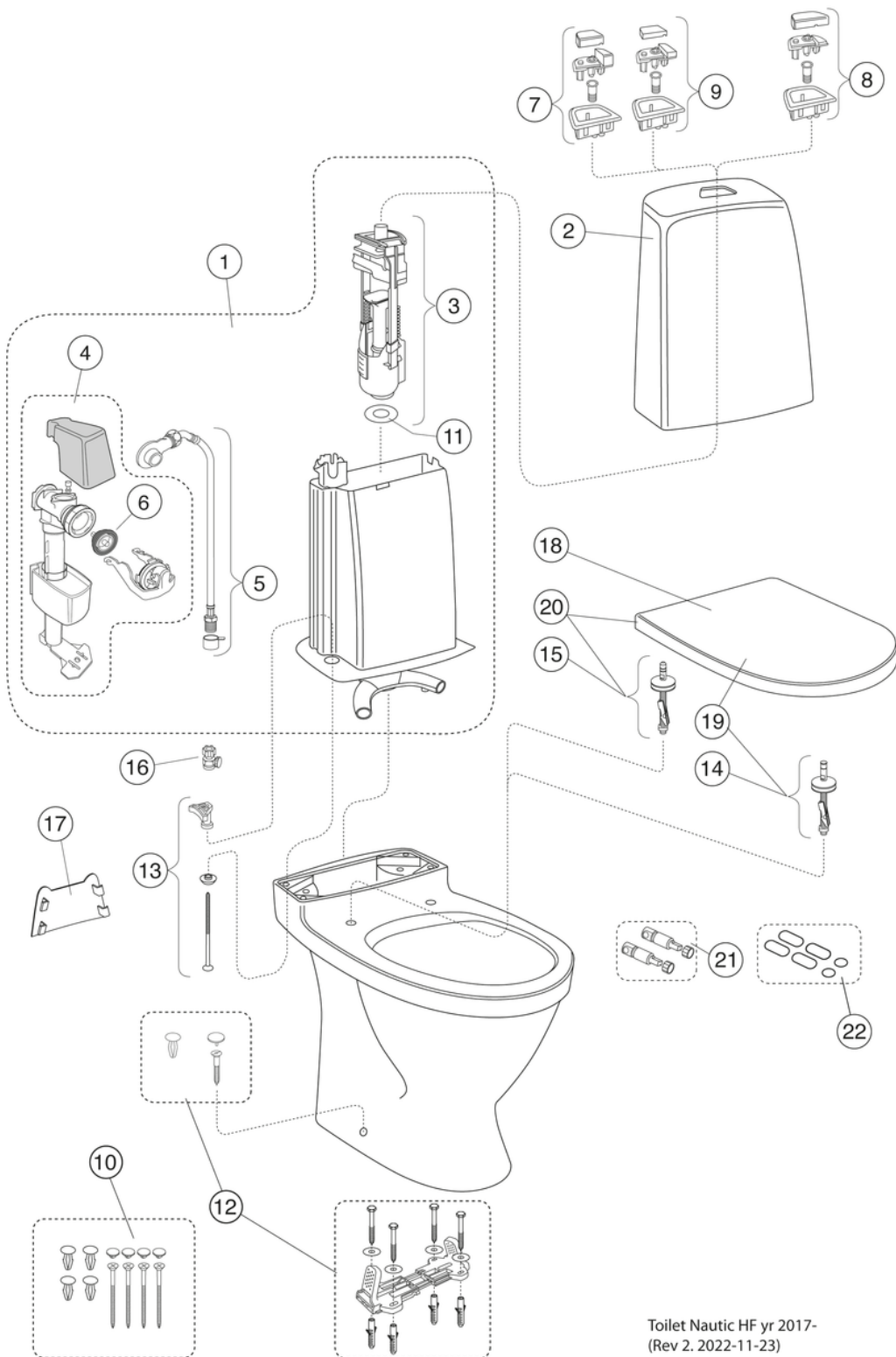
Toilet Nautic HF yr 2017- (Rev 2. 2022-11-23)