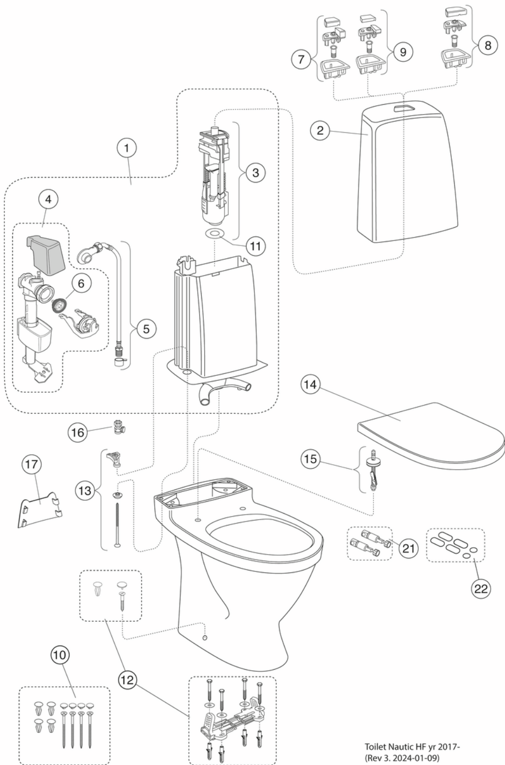
Toilet Nautic HF yr 2017- (Rev 3. 2024-01-09)