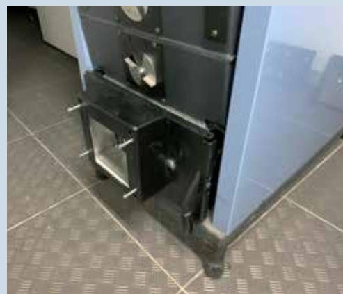
Pelletsluckan på Bonus Light (tillbehör).