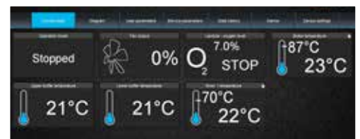
Styrning via ecoNET