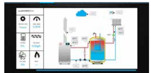
Rapport via ecoNET