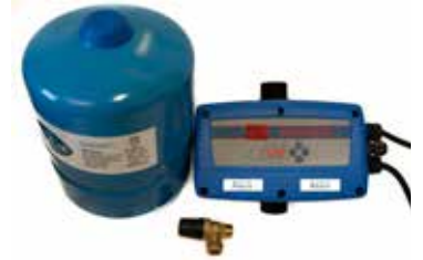
Tillbehör Welldrive sats art nr 5818746