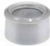
Distansring För tvättställ, utan bräddavlopp. Förkromad ABS. Art nr 8573606