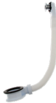
Distansring För tvättställ, vit i ABS med bräddavlopp. Art nr 8573605