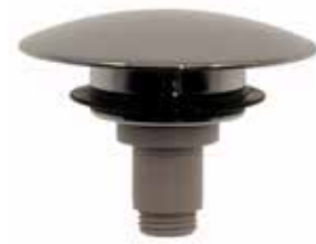
Pop-Up Plugg Passar till Art nr 8573578 Art nr 8573602