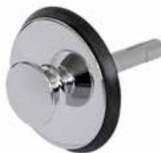
Plugg till vippluggventil Passar till Art nr 8573574, 8573582, 8573584, 8573585. Art nr 8573583