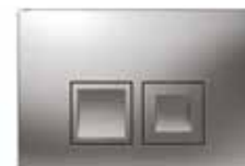
Vit – Art nr 7832377