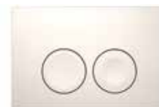
Vit – Art nr 7832372