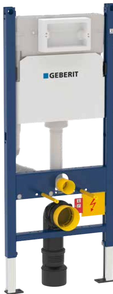
Matt krom Art nr 7972290