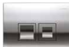
Krom – Art nr 7832376