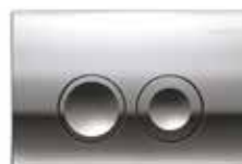
Krom – Art nr 7832373