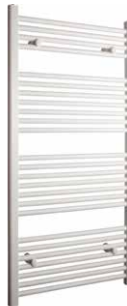
Rak modell, rund design, vit

600 x 1 200 mm (b x h) Effekt: 445 W Art nr 876 00 16