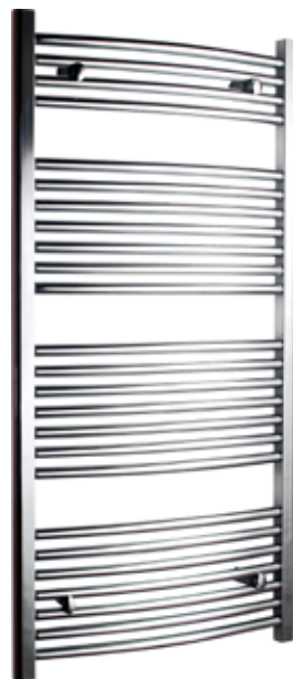
Svängd modell, rund design, förkromad

600 x 1 200 mm (b x h) Effekt: 445 W Art nr 876 00 14