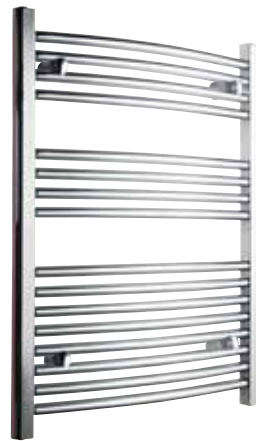
Svängd modell, rund design, förkromad

500 x 800 mm (b x h) Effekt: 246 W Art nr 876 00 13