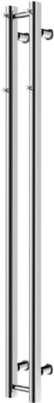
2-rör, krom 120 x 1 400 mm (b x h) Effekt: 148 W Art nr 876 05 28

Alterna Calore handdukstork i förkromat eller matt svart stål. För elpatron och/eller värmesystem. Med vertikala D-rör om 2 respektive 4 stolpar. Levereras med 4 väggfästen, 2 proppar samt en luftningsventil.