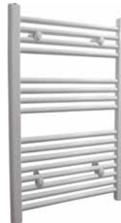
Rak modell, rund design, vit

500 x 800 mm (b x h) Effekt: 246 W Art nr 876 00 15