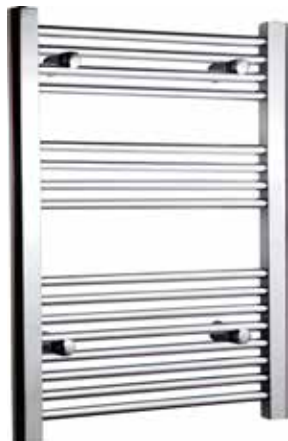
Rak modell, rund design, förkromad

Alterna Caldo Handdukstork i stål. För elpatron och/eller värmesystem. Levereras med fyra stycken flyttbara väggfästen med 22 mm justerbarhet i djupled, två stycken proppar samt en luftningsventil.