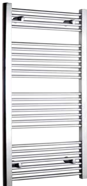
Rak modell, rund design, förkromad

500 x 800 mm (b x h) Effekt: 358 W Art nr 876 00 17