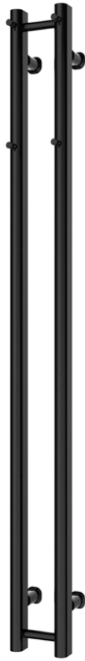
2-rör, matt svart 120 x 1 400 mm (b x h) Effekt: 187 W Art nr 873 02 47