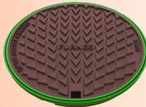
RSK Nr: 6585267

Furnes MILJÖ passar i stort sett alla fabrikats A6-ramar på marknaden.