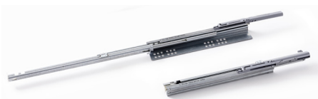
Ifö Sense push-openskena