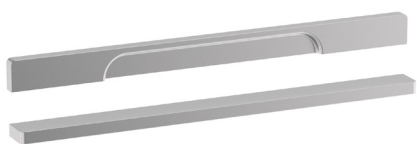
Ifö Sense grepp rak SHR 30