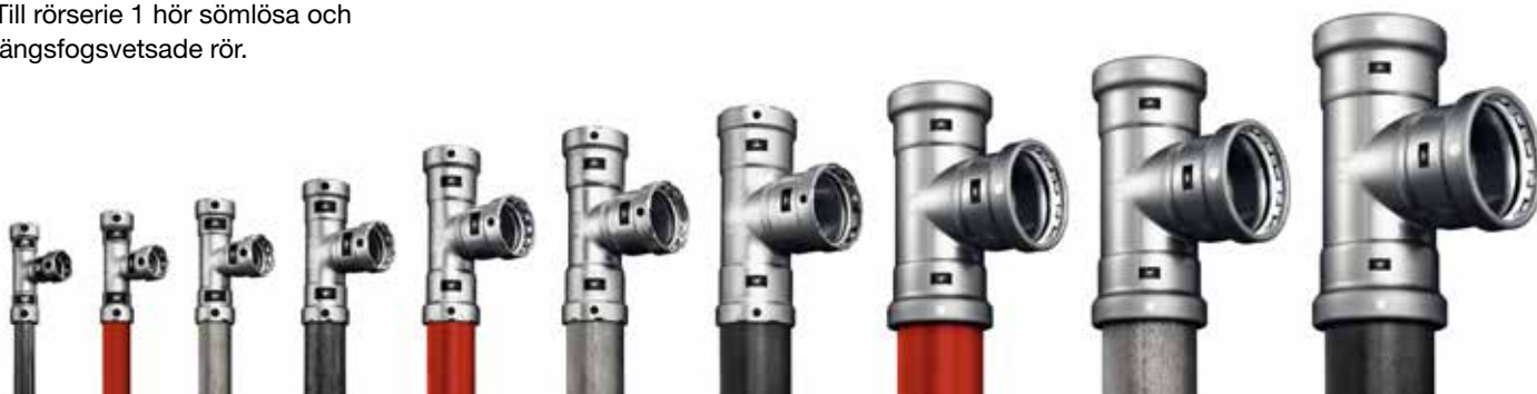
Gängrörskvalitet efter DIN EN 10255, DIN EN 10220/DIN EN 10216-1, DIN EN 10220/DIN10217-1

Sömlöst, svetsat, förzinkat, industrilackat, epoxibehandlade eller svarta: Viega Megapress kopplar rör med mycket varierande ytor. Permanent och säkert – från 3/8" till 4"!