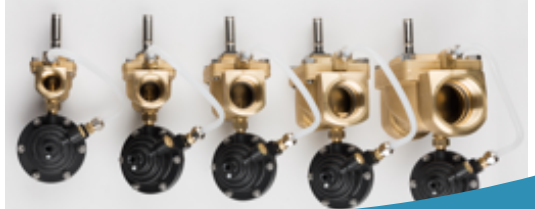
Pro1 i ventilstorlekar DN20 - DN50

Leakomatic Pro1 skyddar fastigheten genom att upptäcka läckagen i vattenledningarna, såväl vattenflöden som små dropläckage.