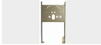
Tvättställsfixtur Universal Justerbar