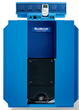
Logano GE 315

Trestråkspannor i gjutjärn, för optimal värmeupptagning och låg miljöpåverkan.