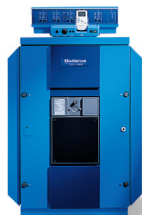
Logano GE 515