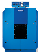
Logano GE 615