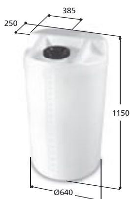
Volym 320 liter Art nr: 10321, vikt 20,0 kg Med Ø 150 mm skruvlock