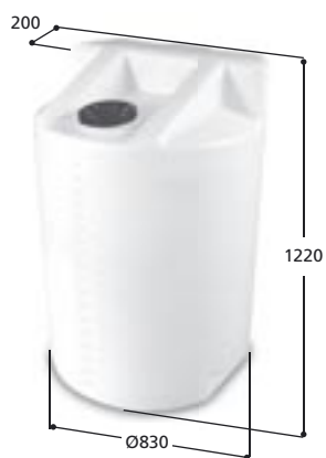
Volym 520 liter Art nr: 10522, vikt 26,0 kg Med Ø 150 mm skruvlock