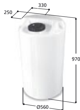
Volym 200 liter Art nr: 10201, vikt 12,0 kg Med Ø 150 mm skruvlock