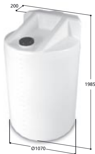
Volym 1500 liter Art nr: 11015, vikt 60,0 kg Med Ø 150 mm skruvlock