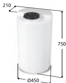
Volym 100 liter Art nr: 10101, vikt 7,5 kg Med Ø 150 mm skruvlock