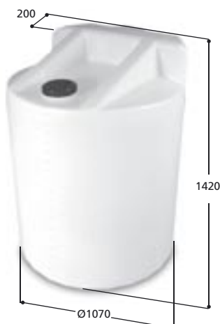
Volym 1000 liter Art nr: 11001, vikt 40,0 kg Med Ø 150 mm skruvlock